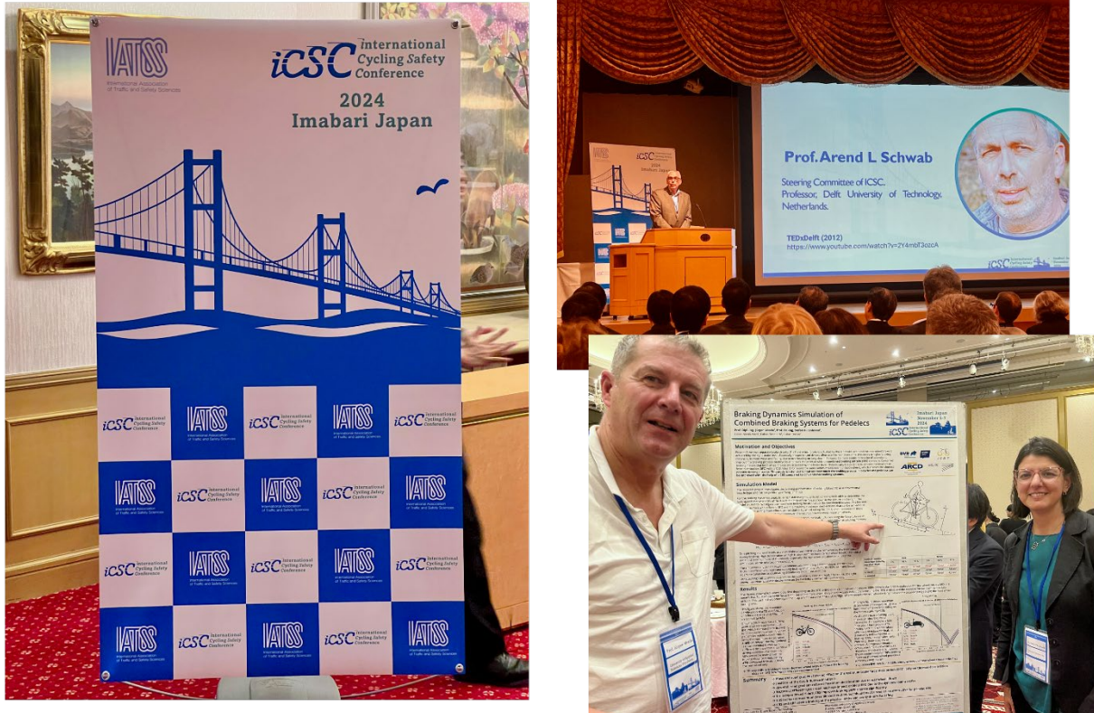
Abb. 6: Posterpräsentation der Simulationsergebnisse auf der International Cycling Safety Conference 2024 im Nov. 2024 in Imabari, Japan